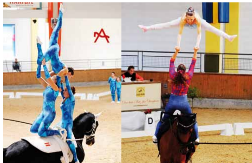
Körperspannung und höchste Konzentration braucht es für diese Akrobatik.