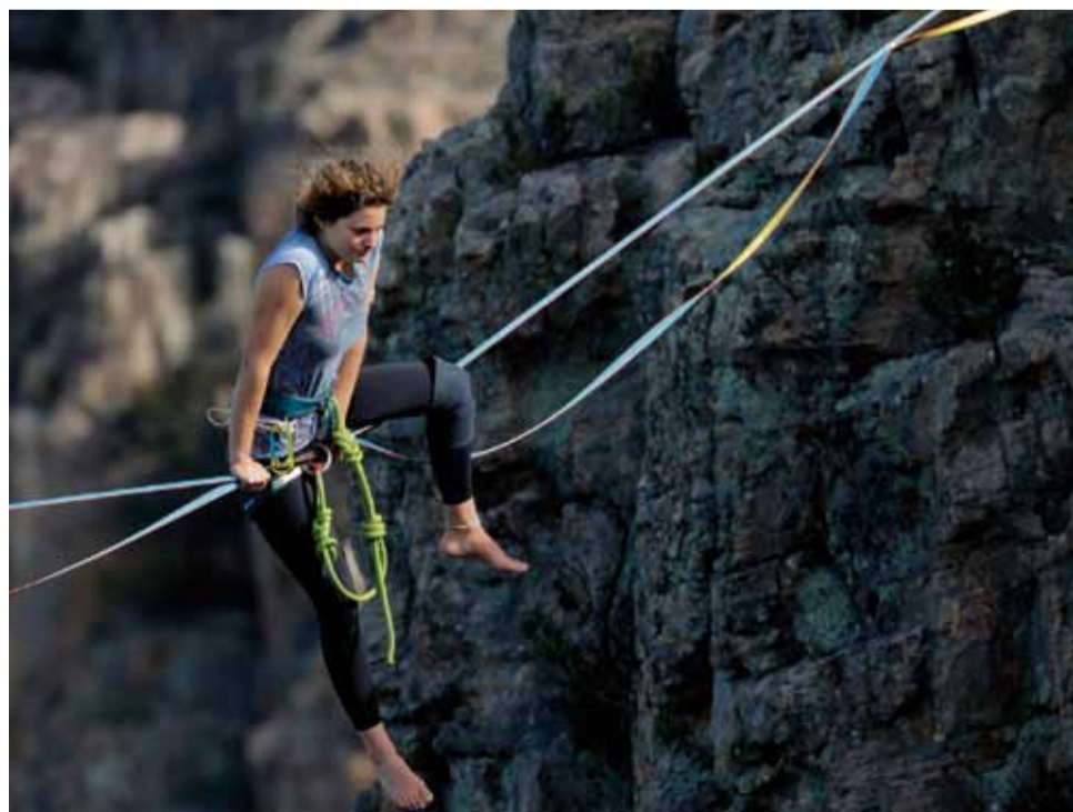
Der Weltrekord auf einer Slackline liegt bei 1,9 Kilometern.

Ein Fest für alle, die gerne zwischendurch, bei Gelegenheit, beruflich oder für ihr Leben gerne balancieren! Work-Life-Balance halt.