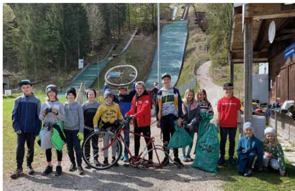
Kinder finden allerlei Müll in Kaltenbach.

Das ASVÖ Nordic Team Salzkammergut ist auch in diesem Jahr wieder bei der Aktion „Hui statt Pfui“ dabei, wenn es darum geht, Mist und weggeworfene Sachen im Kaltenbach und Umgebung einzusammeln. Belohnt wird der Einsatz der NTS-Kinder mit einer kräftigen Jause.