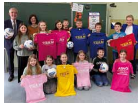
Jede Schule kann Teil des ASVOÖ Bewegungsteams werden und tolle Preise gewinnen.