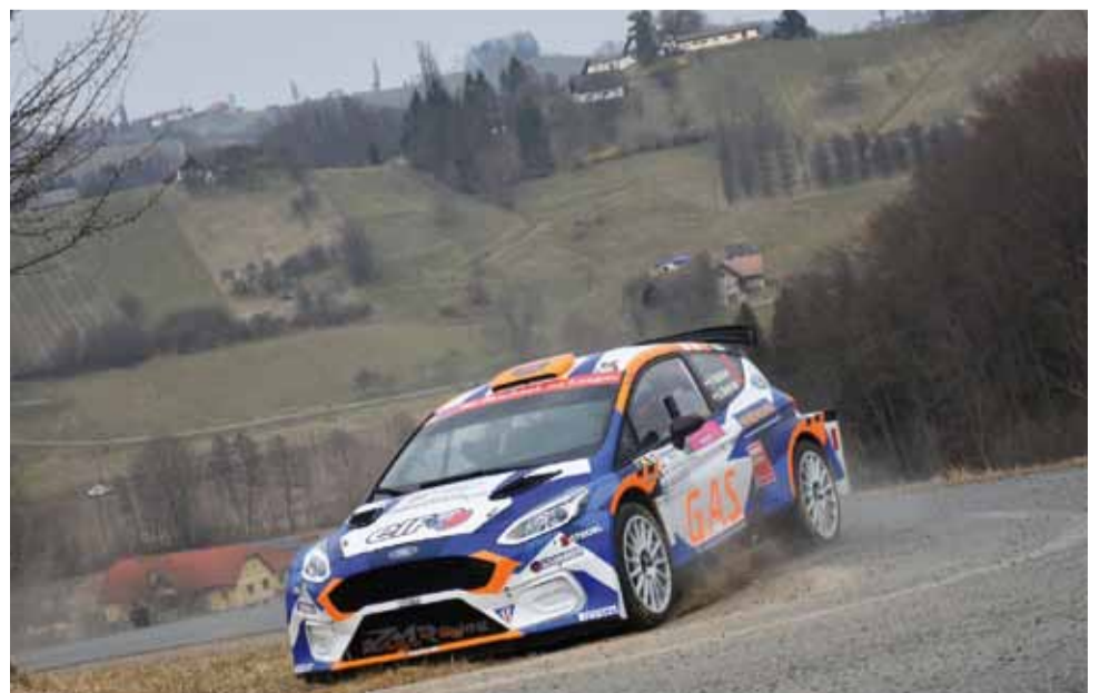
Neubauer/Mayrhofer Ford Fiesta Rallye2 – stark aber heuer noch glücklos.