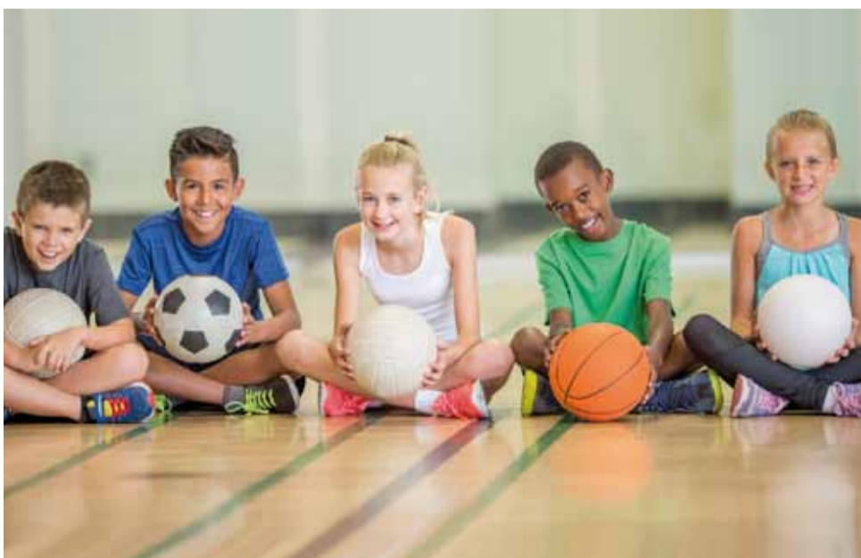
Regelmäßige Bewegung ist auch essentiell für die geistige Entwicklung.

ist auch die immer stärkere Verknüpfung vieler Themenfelder mit den Neurowissenschaften. Klare Botschaft des Kongresses: Jeder Mensch, egal welchen Alters, braucht in seiner Entwicklung regelmäßige körperliche Aktivität, um die notwendigen Prozesse im Gehirn anzuregen. Essentielles Element ist dabei die Freude an der Bewegung. Die zentrale Aufgabe ist, die Menschen für Bewegung und Sport zu begeistern. Allen voran die Kinder, aber auch Eltern, Pädagoginnen und Pädagogen, im Grunde die ganze Gesellschaft. Alle Infos zum Kongress finden sie unter: www.fitsportaustria.at/go/kigebekongress