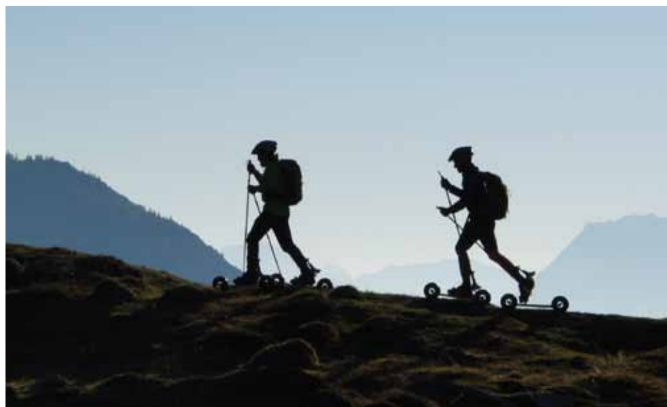
Die moderne Alternative für Skifans plus ideales Training für die Wintersaison.

Skiken bietet Sportsfreunden jeden Alters eine trendige Outdoor-Aktivität, die mit seiner schier ganzjährigen Einsatzmöglichkeit eine konstant hohe Spaß- und Erfolgsquote ermöglicht. Ob als Ergänzung zum beliebten Skilanglaufen, oder gar als Einstieg in die sehr trainingswirksame Materie: Mit geringen Wartungskosten rentiert sich die anfängliche Investition relativ schnell, um sich mittels Maximum-Effekt ein konstant hohes Fitnesslevel zu errollen.